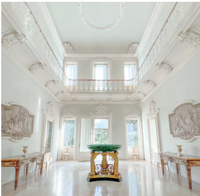
L'Atrio della Villa dei Capolavori

A pochi minuti da Parma, la Fondazione Magnani-Rocca è una delle più importanti istituzioni artistiche d'Italia. La Villa dei Capolavori di Mamiano di Traversetolo ospita la collezione appartenuta al musicologo e critico d'arte Luigi Magnani ed espone il celeberrimo quadro La Famiglia dell'infante don Luis di Francisco Goya e capolavori di Gentile da Fabriano, Filippo Lippi, Ghirlandaio, Dürer, Tiziano, Van Dyck, Canova, Monet, Renoir, Cézanne, Morandi, de Pisis, Guttuso, Burri e altri grandi maestri.