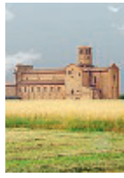
Abbazia di Valserena