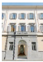
Ape Parma Museo