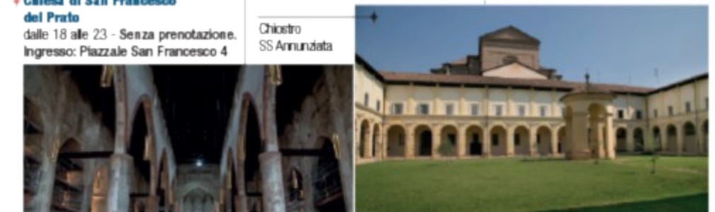
Chiesa di San Francesco

Teatro Regio dalle 18 alle 23 * Ingresso: Strada Garibaldi 16/a