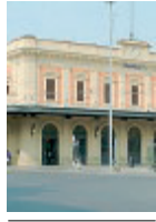
Stazione di Parma