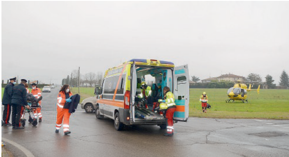
CICLISTA A TERRA I soccorsi alle persone coinvolte nell'incidente sulla rotatoria.

soccorso: l'elicottero giallo è atterrato nel prato compreso tra via Montecoppe e via Pilastrello, ma non si è, poi, reso necessario il suo utilizzo per trasferire il ferito all'ospedale.