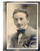
Renato Brozzi Scultore, incisore e orafo, è nato nel 1885 a Traversetolo e si è spento, sempre in paese, nel 1963.