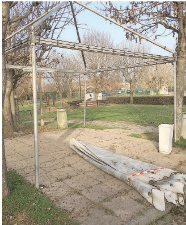
ANCORA DANNI Il gazebo abbattuto l'altra notte.