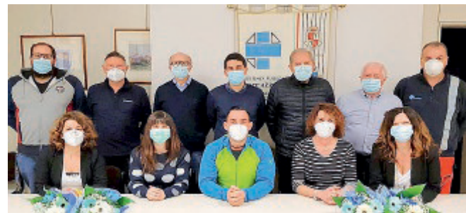
FOTO DI GRUPPO Il nuovo consiglio direttivo.