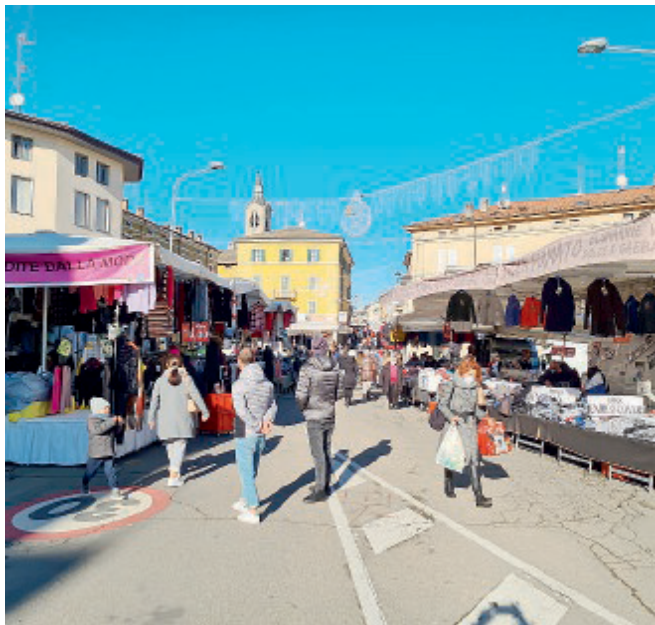
IL MERCATO Nuova collocazione per alcuni banchi.

Un piano partito dalla ricognizione delle concessioni, per eliminare quelle scadute, e individuare le differenze rispetto alle superfici realmente utilizzate dalle bancarelle. Sono quindi stati spostati alcuni banchi per compattare l'area mercatale, portando a liberare 11 posti che nei prossimi mesi verranno messi a bando. Un lavoro, come aveva sottolineato il sindaco Simone Dall'Orto, che è stato portato avanti confrontandosi con le associazioni di categoria.