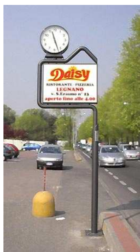
Impianto pubblicitario di servizio